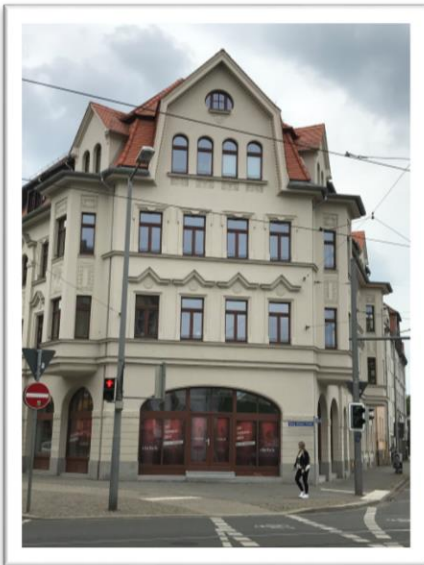
Eine Ehrlich Friseur-Filiale eröffnet im Sommer in der Rückmarsdorferstrasse 1.