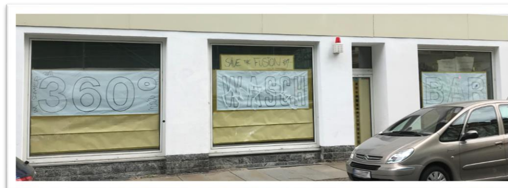
In der Georg-Schwarz-Straße 2 wird mit der „360° Waschbar“ ein Café und Waschsalon entstehen.