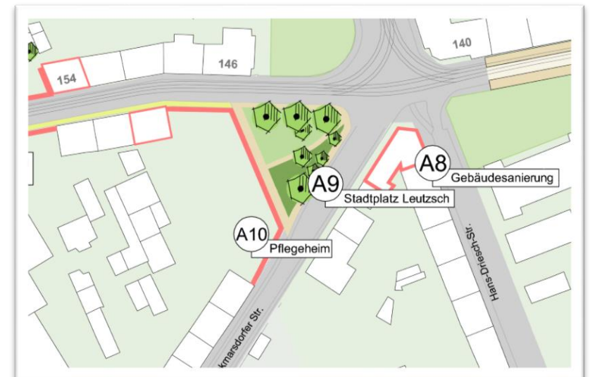
Auszug aus dem Städtebaulichen Entwicklungskonzept für die Georg-Schwarz-Straße

Auch eine Visualisierung der Fassade konnte uns derzeit noch nicht zur Verfügung gestellt werden. Sobald es Neuigkeiten zum Baufortschritt, zur Grünflächenplanung und zur Fassade gibt, werden wir Sie wieder informieren. Wir bleiben für Sie dran.