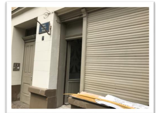
In der Georg-Schwarz-Straße 122 wird ein Wimpernstudio ausgebaut, das diesen Sommer eröffnen soll.